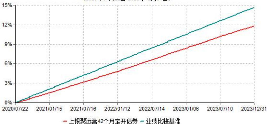
上银聚远盈42个月定期开放债券型证券投资基金累计净值增长率与业绩比较基准收益率历史走势对比图 (2020年07月22日-2023年12月31日)

注：本基金合同生效日为2020年7月22日，自基金合同生效日起6个月内为建仓期，建仓期结束时各项资产配置比例符合基金合同约定。