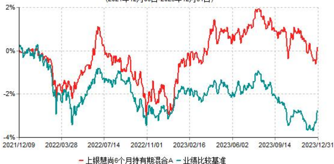
上银慧尚6个月持有期混合A累计净值增长率与业绩比较基准收益率历史走势对比图 (2021年12月09日-2023年12月31日)