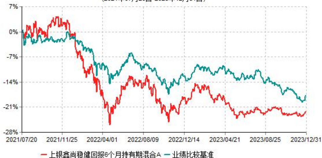
上银鑫尚稳健回报6个月持有期混合A累计净值增长率与业绩比较基准收益率历史走势对比图 (2021年07月20日-2023年12月31日)