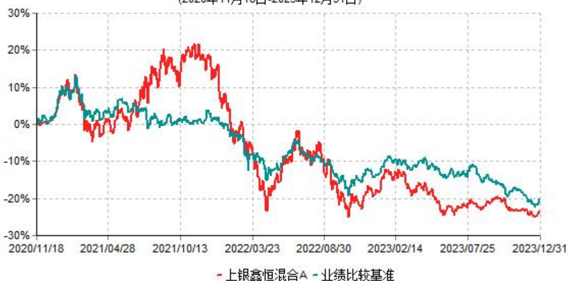
上银鑫恒混合A累计净值增长率与业绩比较基准收益率历史走势对比图 (2020年11月18日-2023年12月31日)