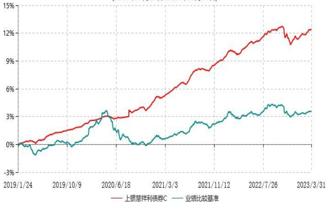
上银慧祥利债券C累计净值增长率与业绩比较基准收益率历史走势对比图 (2019年01月24日-2023年03月31日)

注：本基金合同生效日为2019年1月24日，自基金合同生效日起6个月内为建仓期，建仓期结束时各项资产配置比例符合基金合同约定。