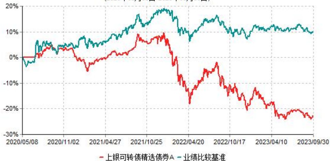
上银可转债精选债券A累计净值增长率与业绩比较基准收益率历史走势对比图 (2020年05月08日-2023年09月30日)