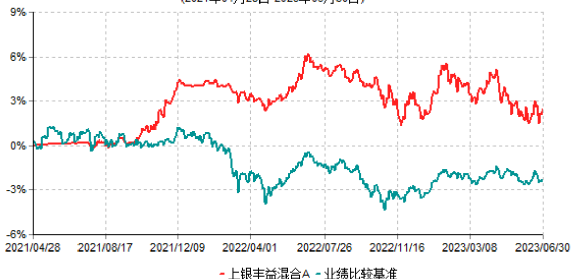
上银丰益混合A累计净值增长率与业绩比较基准收益率历史走势对比图 (2021年04月28日-2023年06月30日)