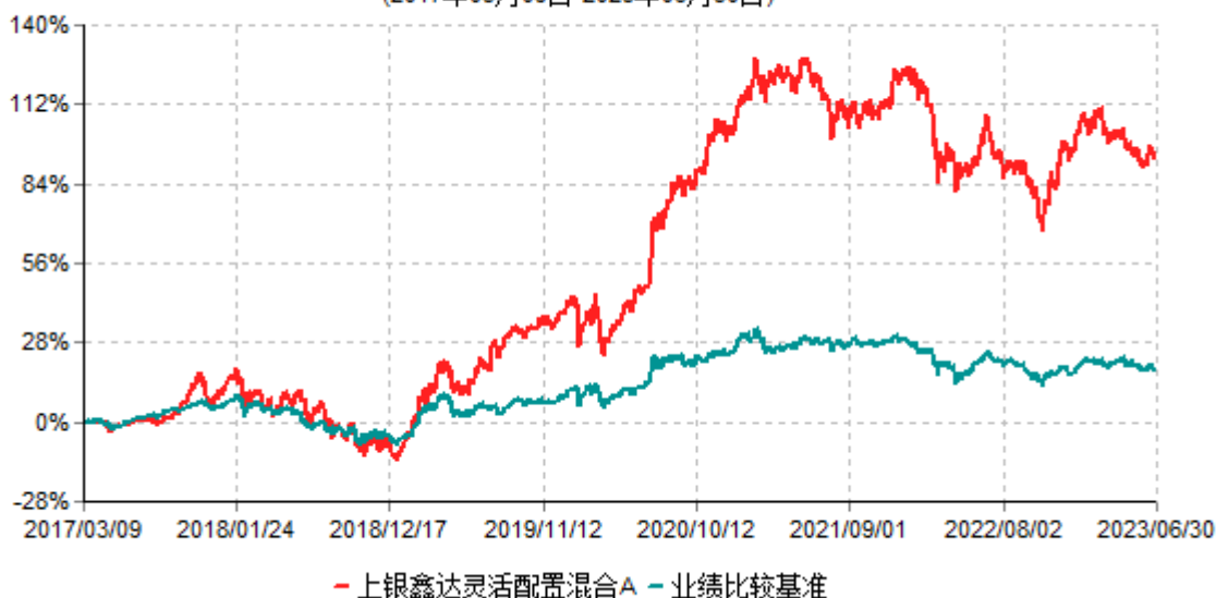
上银鑫达灵活配置混合A累计净值增长率与业绩比较基准收益率历史走势对比图 (2017年03月09日-2023年06月30日)