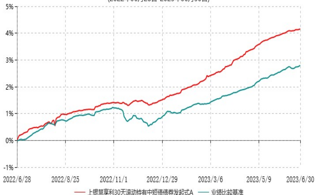
上银慧享利30天滚动持有中短债债券发起式A累计净值增长率与业绩比较基准收益率历史走势对比图 (2022年06月28日-2023年06月30日)