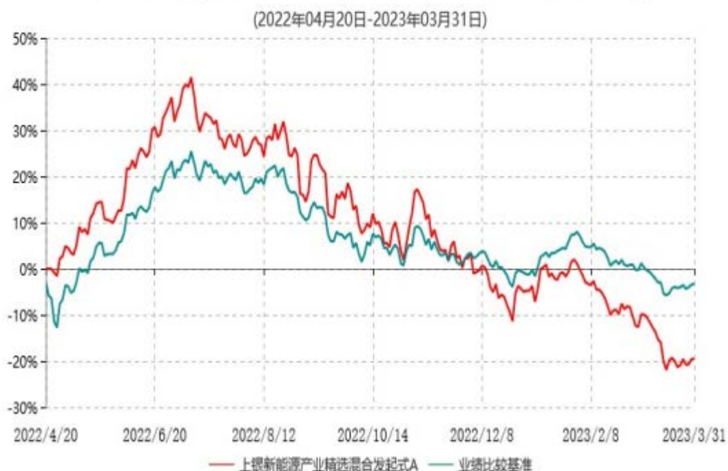
上银新能源产业精选混合发起式A累计净值增长率与业绩比较基准收益率历史走势对比图