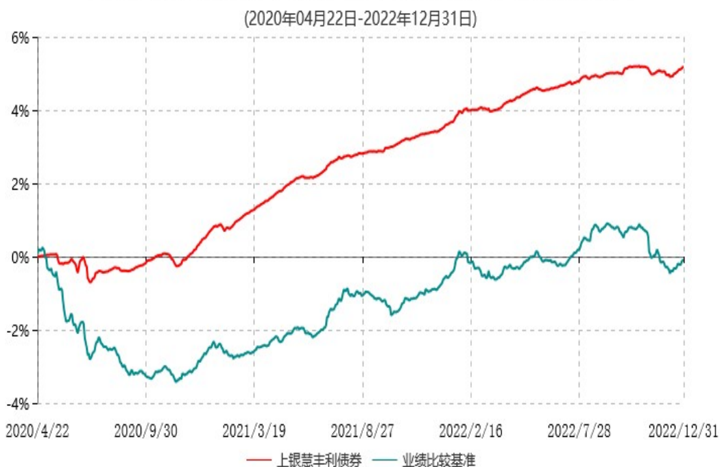
上银慧丰利债券型证券投资基金累计净值增长率与业绩比较基准收益率历史走势对比图

注：本基金合同生效日为2020年4月22日，自基金合同生效日起6个月内为建仓期，建仓期结束时资产配置比例符合基金合同约定。