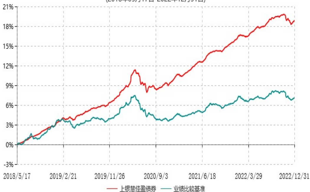
上银慧佳盈债券型证券投资基金累计净值增长率与业绩比较基准收益率历史走势对比图 (2018年05月17日-2022年12月31日)

注：本基金合同生效日为2018年5月17日，自基金合同生效日起6个月内为建仓期，建仓期结束时各项资产配置比例符合基金合同约定。