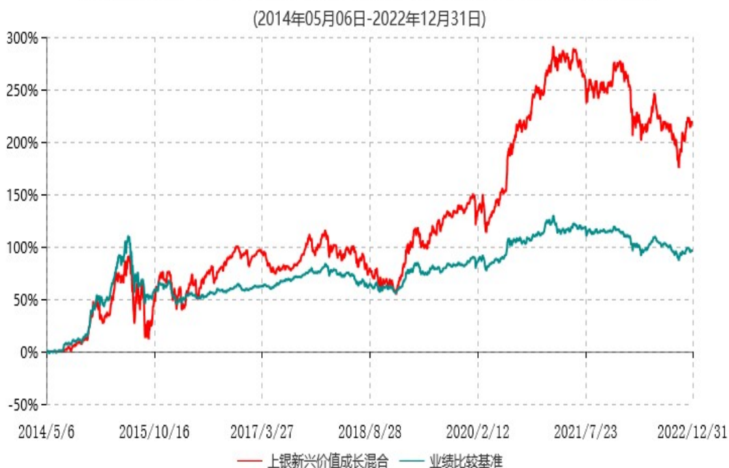
上银新兴价值成长混合型证券投资基金累计净值增长率与业绩比较基准收益率历史走势对比图

注：1、本基金合同生效日为2014年5月6日，自基金合同生效日起6个月内为建仓期，建仓期结束时资产配置比例符合基金合同约定。