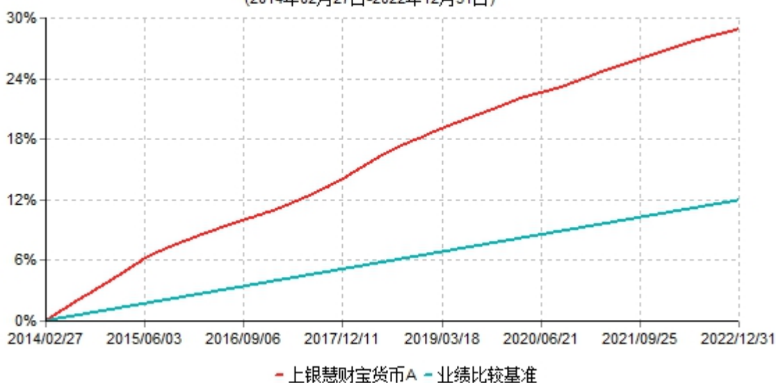
上银慧财宝货币A累计净值收益率与业绩比较基准收益率历史走势对比图 (2014年02月27日-2022年12月31日)