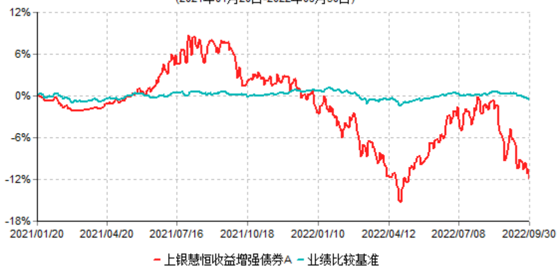
上银慧恒收益增强债券A累计净值增长率与业绩比较基准收益率历史走势对比图 (2021年01月20日-2022年09月30日)