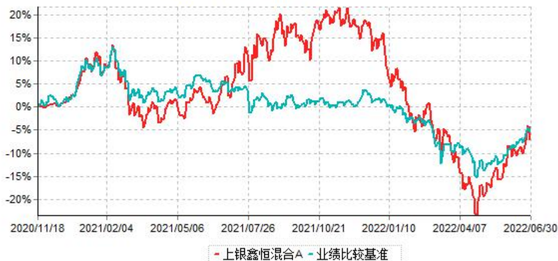
上银鑫恒混合A累计净值增长率与业绩比较基准收益率历史走势对比图 (2020年11月18日-2022年06月30日)