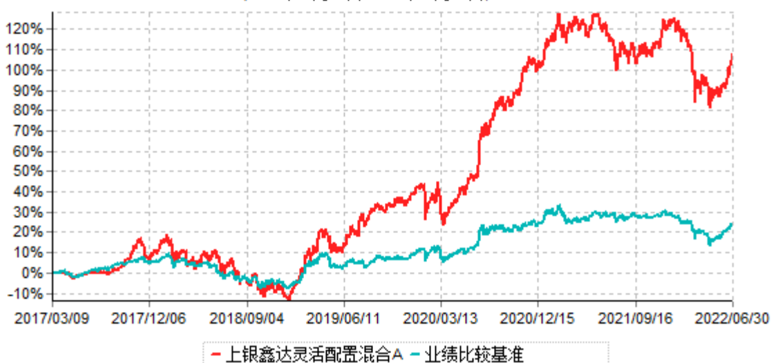
上银鑫达灵活配置混合A累计净值增长率与业绩比较基准收益率历史走势对比图 (2017年03月09日-2022年06月30日)