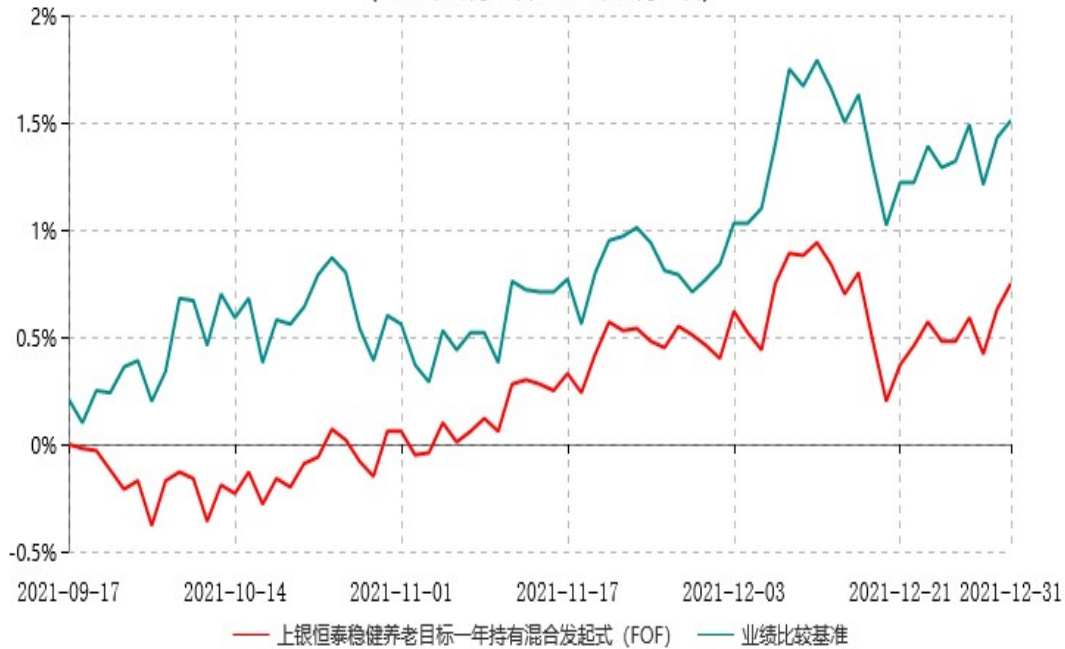
上银恒泰稳健养老目标一年持有期混合型发起式基金中基金（FOF）累计净值增长率与业绩比较基准收益率历史走势对比图 (2021年09月17日-2021年12月31日)

注：本基金合同生效日为2021年9月17日，自基金合同生效日起6个月内为建仓期，截至本报告期末，本基金仍处于建仓期；截至本报告期末，基金合同生效不满一年。