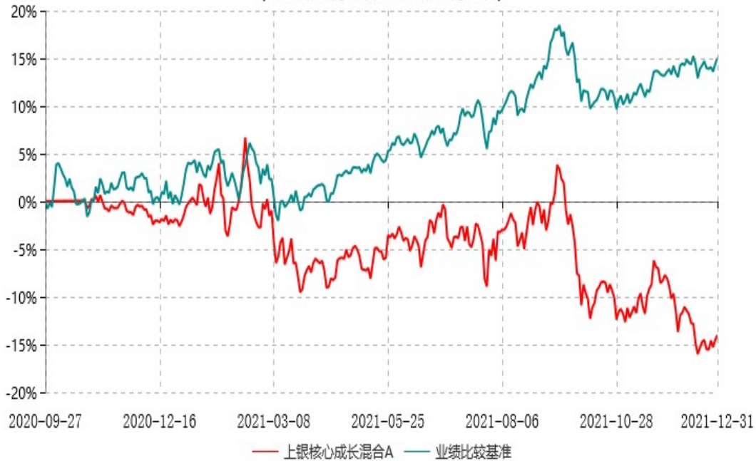
上银核心成长混合A累计净值增长率与业绩比较基准收益率历史走势对比图 (2020年09月27日-2021年12月31日)