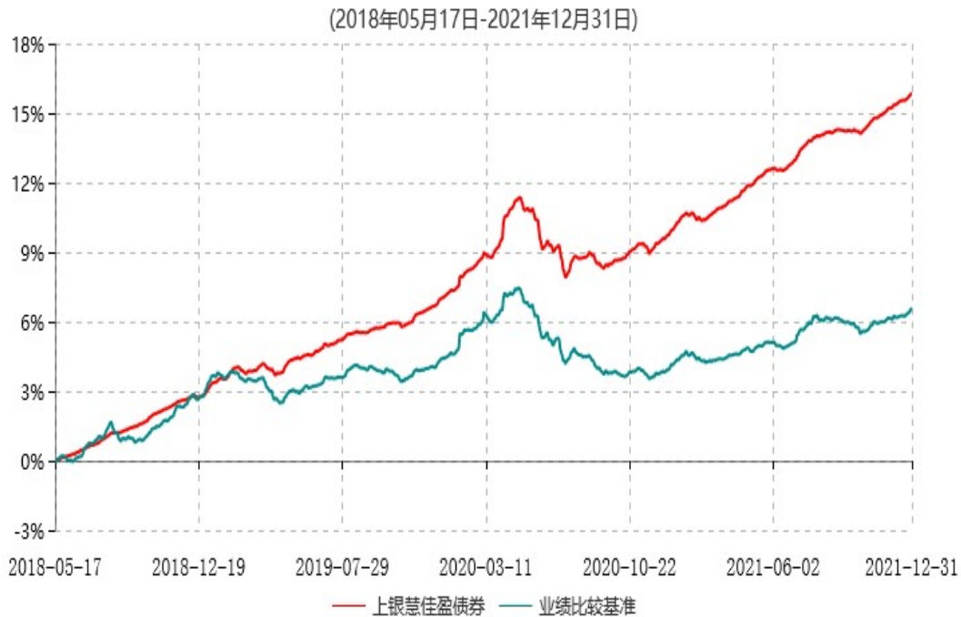
上银慧佳盈债券型证券投资基金累计净值增长率与业绩比较基准收益率历史走势对比图

注：本基金合同生效日为2018年5月17日，自基金合同生效日起6个月内为建仓期，建仓期结束时各项资产配置比例符合基金合同约定。