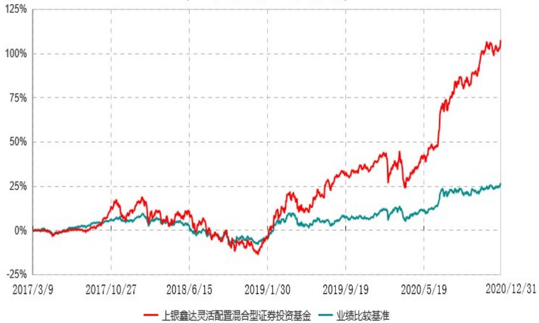
上银鑫达灵活配置混合型证券投资基金累计净值增长率与业绩比较基准收益率历史走势对比图 (2017年03月09日-2020年12月31日)

注：本基金合同生效日为2017年3月9日，自基金合同生效日起6个月内为建仓期，建仓期结束时各项资产配置比例符合基金合同约定。