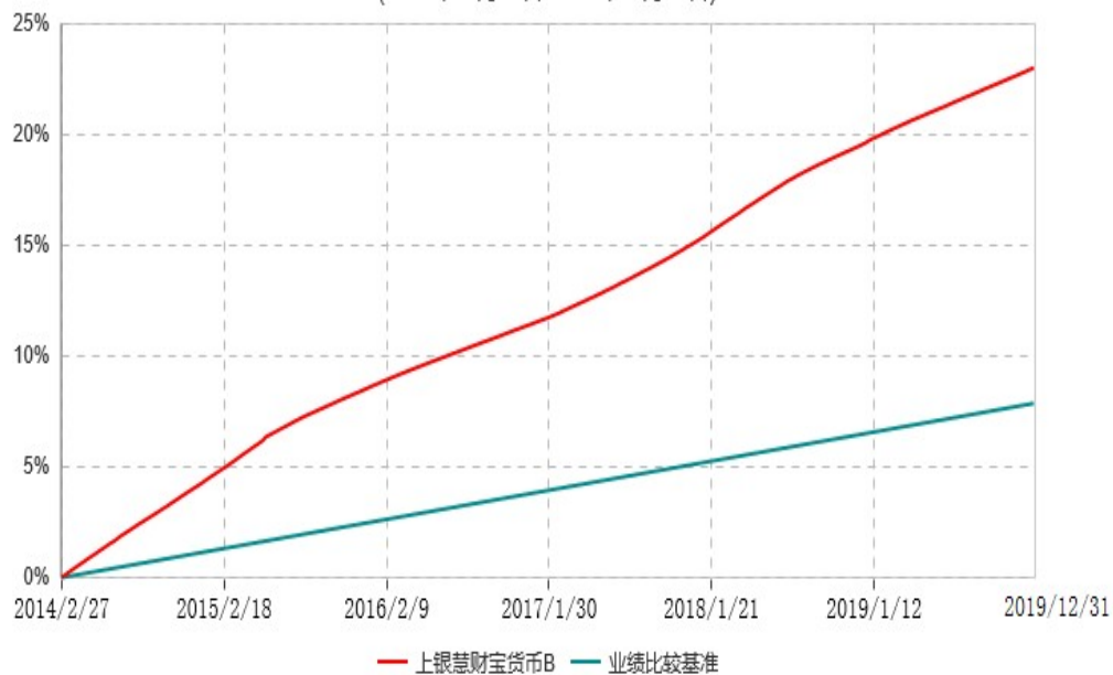
上银慧财宝货币B累计净值收益率与业绩比较基准收益率历史走势对比图 (2014年02月27日-2019年12月31日)