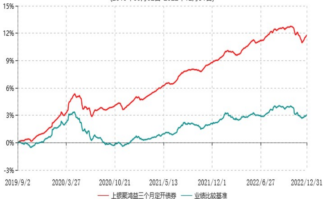
上银聚鸿益三个月定期开放债券型发起式证券投资基金累计净值增长率与业绩比较基准收益率历史走势对比图 (2019年09月02日-2022年12月31日)